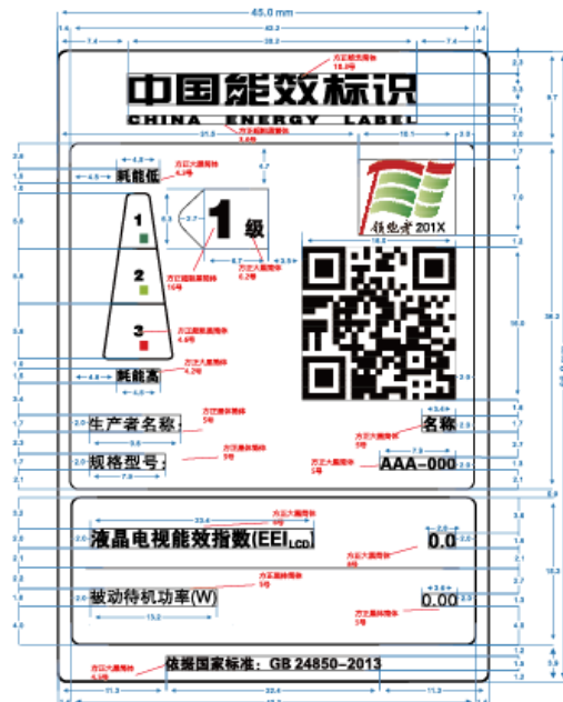
图 1 液晶电视能源效率标识样式示例