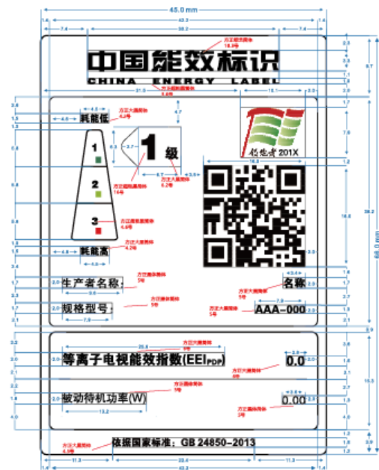
图 2 等离子电视能源效率标识样式示例